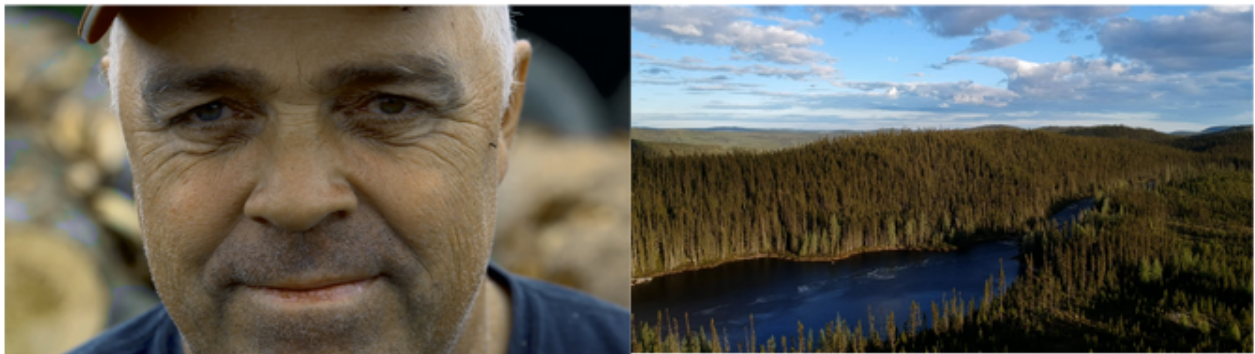
Images tirées du film « Rien n'est moins vierge qu'une forêt. » de Josianne Cloutier

Spira est l'organisme gestionnaire de la nouvelle mesure Première Ovation Cinéma, lancée en mars 2019. La mesure permet, entre autres, de soutenir les premières expériences professionnelles et les projets artistiques qui contribuent à la professionnalisation de la relève cinématographique locale. Elle se divise en trois volets : le fonds de formation et de développement professionnel, le mentorat et le fonds de soutien aux initiatives de la relève en cinéma, permettant la production, la postproduction et la mise marché et découvrabilité d'œuvres cinématographiques.